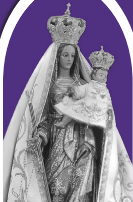
Nra. Sra. del Rosario